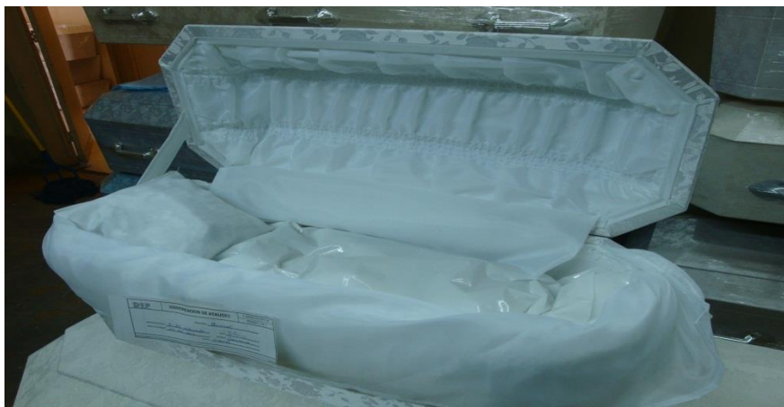
ATAÚD DE MADERA INFANTIL RECTANGULAR, PARTIDAS 4, 5