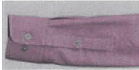
Puños redondeados, ajustable con botones, 2 pzas. #18 Aletilla con botón en medio 1pza. #16