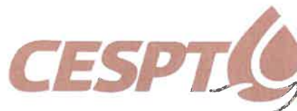
Color Oficial Contrastante